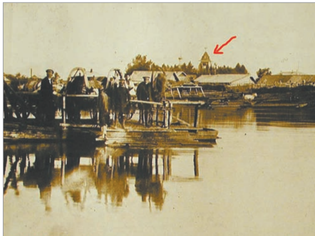
1910-1913 гг. Казаки переправляются через реку Томь из Бочкаревки в Александровское (ныне Белогорск). На заднем плане: Свято-Троицкий храм в центре села

Средний храм до арки, за которой следует притвор, величиною в квадратную сажень, довольно обширен и поместителен. В нем свободно могут присутствовать при богослужении 200-250 богомольцев. Стены его в прежние времена были оклеены цветными обоями. На них находились в деревянных рамках иконы Божией Матери и мученицы Фервуфы. Последняя была куплена прихожанами в память спасения Государя Императора Александра II от смертной опасности 4 апреля 1868 года. Из этих икон не сохранилось ни одной. Теперь же стены